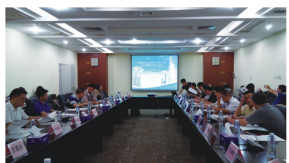
如何利用政府与企业合作(PPP)模式达成智慧城市项目沙龙会议