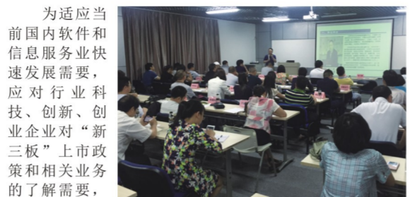
协会“新三板”业务培训会现场

为适应当前国内软件和信息技术服务业快速发展需要,应对行业科技、创新、创业企业对“新三板”上市政策和相关业务