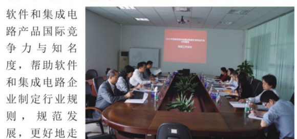
高新区软件和集成电路外贸转型升级示范基地现场工作会议

2010年,受市科工信局的委托,由珠海市软件行业协会执笔申报的“高新区软件和集成电路外贸转型升级示范基地”被认定为广东省首批外贸转型升级示范基地,基地内公共技术平台连续五年获得省级财政资金支持。为加大对基地的扶持力度,2015年,基地将重点开展集体商标建设、整合行业资源,树立行业标准和规范、扶持龙头企业带动中小企业发展等方式提升高新区