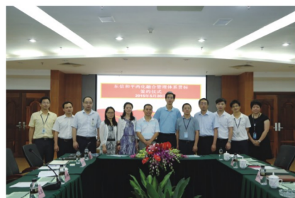
两化融合管理体系贯标工作启动仪式

日前,东信和平科技股份有限公司、珠海优特电力科技股份有限公司、珠海方正科技高密电子有限公司、珠海万力达电气自动化有限公司分别召开国家两化融合管理体系贯标启动大会,正